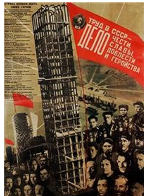
In de SU werkte bijna iedereen die kon werken. Tekst op de poster: 'Arbeid in de USSR is een zaak van eer, glorie, moed en heldhaftigheid' (Gustav Klutssis, 1931).

Er zijn drie redenen voor de huidige lage werkloosheid in de krimpende Russische economie. Ten eerste zijn Russische werknemers en werkgevers gewend elkaar trouw te blijven. Een culturele kwestie. Als bedrijven moeten inkrimpen, ontslaan ze pas in laatste instantie hun personeel en bezuinigen liever op de loonkosten door de lonen te verlagen, met name op het grote flexibele deel van de loonkosten. Simpel gezegd zijn in Rusland de lonen flexibel en de banen permanent.